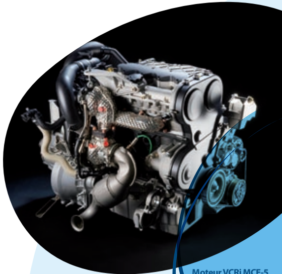
Moteur VCRi MCE-5 VCRi MCE-5 engine

Projet de R&D de la société MCE-5 DEVELOPMENT, soutenu par Rhône-Alpes Automotive Cluster FLOWER II – Flexible and Operational vehicles for automotive Wide-scale Emissions Reduction